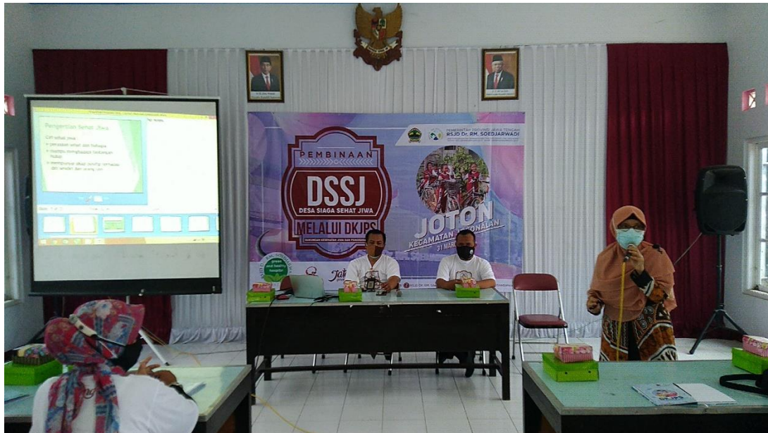
FOTO - FOTO KEGIATAN PEMBINAAN KADER DSSJ DAN BAKSOS ODGJ 31 MARET 2021

Jalan Ki Pandanaran Km.2 Klaten 57425 Telp. 0272-321435, Faks 0272-321418 Website : rsjd-sujarwadi.jatengprov.go.id e-mail : soedjarwadi@jatengprov.go.id